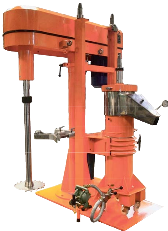
Compact Simplex CS-1 de 25 cv